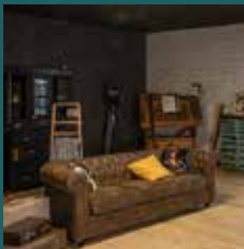
Dark academia stijl woonkamer