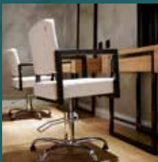
Visagie- en kleedruimte