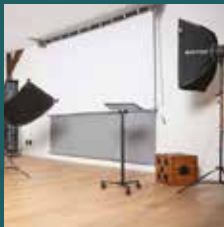
Neutrale (witte) portretstudio